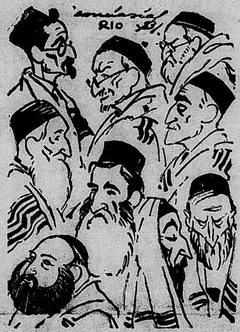
Tipos de judeus do bairro israelita desta capital

Um estigma — E como os semitas encaram essa questão? — Como um ponto de honra.